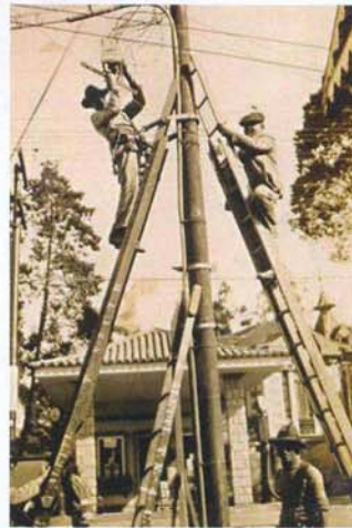
A expansão da rede da antiga Companhia Telefônica Brasileira se deu nas mais precárias condições. Abaixo, um posto telefônico da primeira metade do século passado.

De 20/8 a 4/10, de terça a domingo, das 9h às 18h30, no Museu Nacional da República. Mais informações: 3325.5220, 3325.6410 ou www.taolongetaoaperto.org.br . Visitas orientadas: 3349.8124. Entrada franca, com acesso e atendimento a portadores de necessidades especiais.