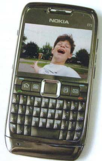
Os celulares dos anos 90 são peças de museu em comparação com os de hoje, que exercem múltiplas funções – entre elas o acesso à internet, a edição de textos, a produção de fotos e filmes e a videochamada