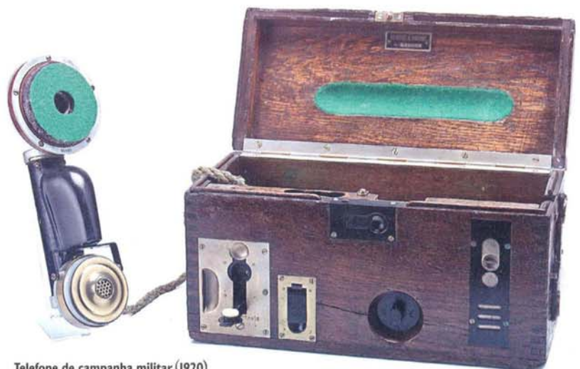
Telefone de campanha militar (1920)

Não é difícil imaginar com que velocidade as telecomunicações brasileiras precisaram evoluir a partir daí – principalmente após as privatizações, na década de 90 – para tirar um atraso de mais de cem anos. É o que poderão ver, até 4 de outubro, os visitantes da exposição Tão longe, tão perto , que a Fundação Telefônica vai apresentar no Museu da República. "Será uma oportunidade de conhecer um pouco mais da história das telecomunicações no país e refletir sobre a evolução tecnológica nessa área", diz o presidente do grupo Telefônica, Antonio Carlos Valente.