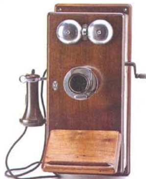
Magneto de parede do século XX